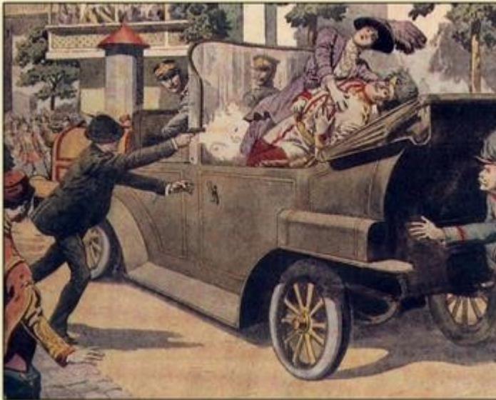
Assassinat de l'archiduc et de son épouse

Au début du XXème siècle, de grandes tensions sont présentes entre les pays européens. Cependant, malgré cette division de l'Europe, rien ne laisse entrevoir une crise majeure internationale. "L'étincelle" qui va déclencher cette guerre survient à Sarajevo, capitale de la Bosnie-Herzégovine, une possession de l'Autriche-Hongrie : le 28 juin 1914, un terroriste serbe tue l'archiduc Ferdinand, héritier de la couronne austro-hongroise, et sa femme.