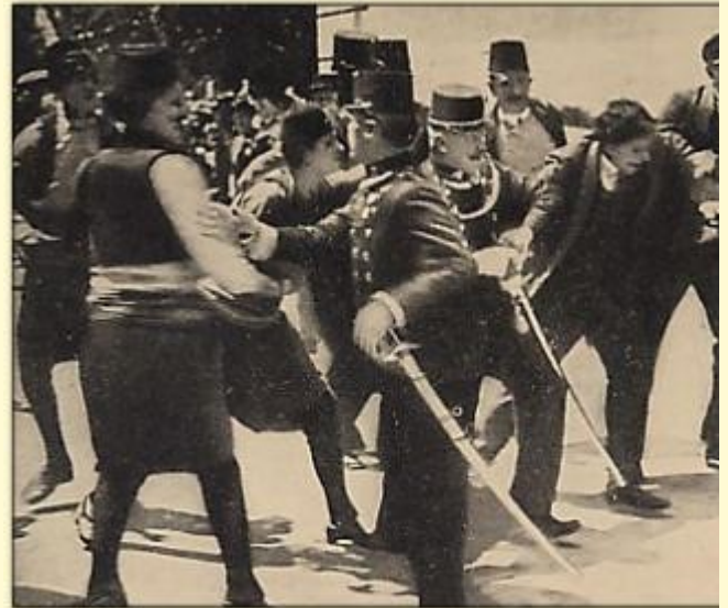
Arrestation mouvementée de Gavrilo Princip à Sarajevo, après l'assassinat de l'archiduc François-Ferdinand

L'empereur autrichien François-Joseph 1er veut donner une leçon à la Serbie. La Russie apporte son soutien à cette dernière, par solidarité slave (ils ont la même culture). La France se sent obligée d'apporter sa garantie à la Russie. L'Allemagne, de son côté, se doit de soutenir l'Autriche.