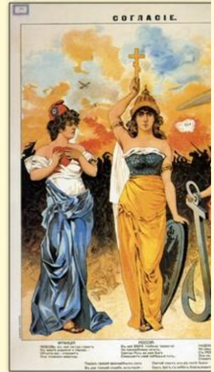
Triple Entente : France (Marianne), Russie (au milieu) et Angleterre