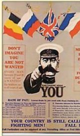
Affiche de recrutement britannique