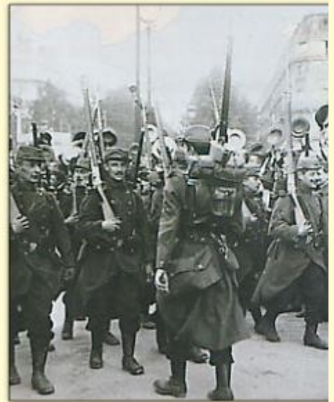
Départ des soldats français en août 1914 : on pensait que la victoire contre les Allemands serait facile et que le conflit serait court.

À savoir: Contrairement à une idée reçue, les Français ne sont pas partis à la guerre avec "enthousiasme". À l'annonce de la mobilisation, la surprise fut plutôt générale et les soldats français partirent avec acceptation et résignation .