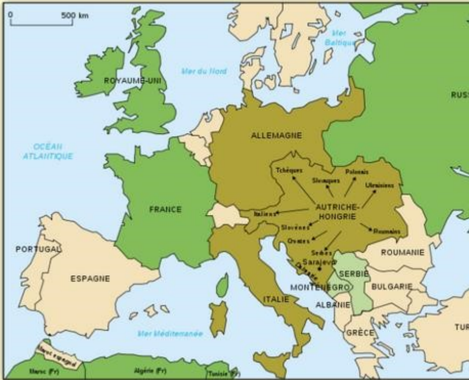
La carte des alliances