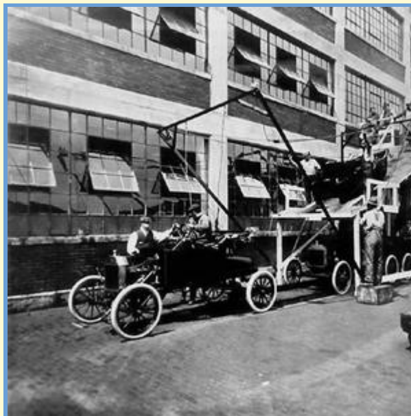
Chaîne de production de la Ford T aux États-Unis

En France , c'est André Citroën qui met en place le travail à la chaîne, en 1921 , en suivant les principes de son homologue américain.