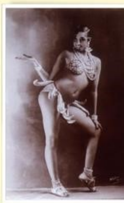
Joséphine Baker, figure emblématique des « années folles » en France