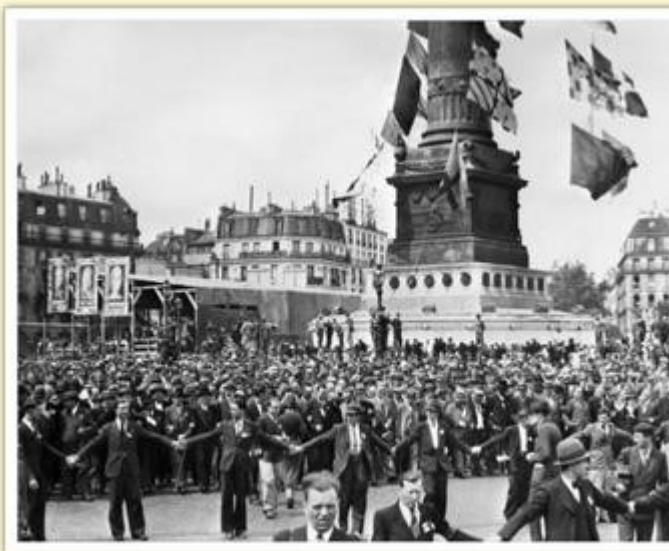
1936, la foule fête la victoire du Front populaire à Paris

Cependant, la situation économique ne s'est pas améliorée depuis 1929 : les prix augmentent et le chômage ne diminue pas. Léon Blum démissionne en 1937 et la droite revient au pouvoir.