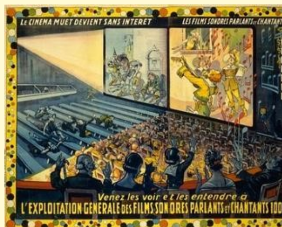
Le cinéma devient parlant