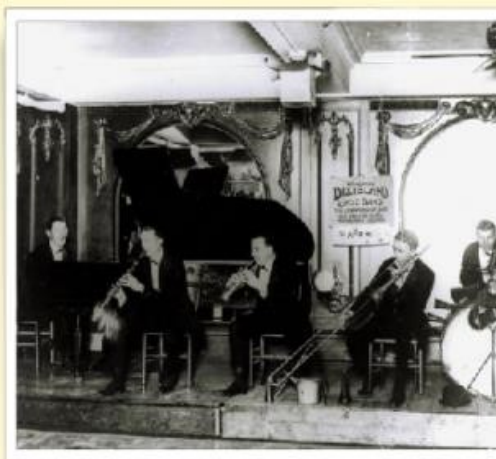
Les orchestres de jazz font leur apparition en France

Le mode de vie des Français va peu à peu se transformer. Les automobiles se font moins rares grâce au travail à la chaîne qui permet une fabrication en série. Dans les foyers, l'électricité et le gaz sont utilisés plus largement. Les Français profitent plus amplement de la vie (la journée de travail passe à 8 heures en 1919) et découvrent la radio et le cinéma (parlant à partir de 1929). Ils découvrent aussi, grâce aux Américains, le jazz, la danse et certains sports.