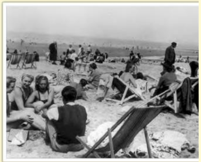
1936 a permis à des milliers de familles de partir en vacances