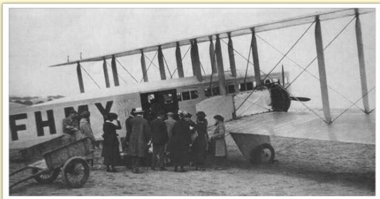
Farman F-60 'Goliath', un des premiers avions des lignes régulières en Europe (ici ligne Paris-Londres)

C'est aussi pendant cette période que les premiers dessins animés Walt Disney font leur apparition aux États-Unis.